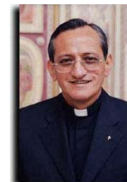
D. Pascual Chavez vrhovni poglavar