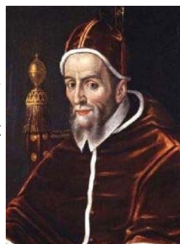
Papa Urban II

Malo bi tko rekao da imena Zdenka i Sidonija imaju nešto zajedničko. Što imaju i nemaju. Sidonija izvorna znači ona koja je rodom iz Sidona (starifenički grad u Libanonu, koji danas nosi ime Saida). Ime Zdenka dolazi k nama s češkog područja. Nije oblikovano prema izvornome značenju, nego po sličnosti, kao inačica imena Sidon, Sidonija (zapravo po malom drukčijem izgovoru: Zidon, Zidonija). Uporabom je zaboravljeno da je to izvorno ime (Zidon), nego se po izmijenjenom (češkom) izgovoru smatralo da dolazi od glagola zdeti, koji znači činiti, raditi, graditi. Čudni putovi imena! Danas ima nekoliko oblika ovog imena: Sida, Dona, Donka, Sidonka, Sija, Sdenka, Zdena; Muški je oblik Sidon, Sidonije, rijedak je Zdenko ili Zdeno učestaliji. Nema svetice toga imena, ali postoji malo poznati sveti Sidonije iz Normandije, opat samostana Saint-Saens, koji je umro godine 685. Slikaju ga u monaškoj odjeći s opatskim štapom i knjigom. U kalendaru je 14. studenoga, ali ga redovito ne čemo naći, jer je u taj nadnevak važniji hrvatski svetac Nikola Tavelić. Zato ga neki stavljaju 23. lipnja, i to kao Sidonija. Još je jedan sveti Sidonije, a spomendan mu je 23. kolovoza. Rođen je oko godine 433. u Lyonu u rimskoj senatorskoj obitelji. Vrlo je brižljivo odgojen i školovan. Bio je pjesnik, pisac i političar. Imenovan je prefektom Rima, a zatim imenovan biskupom u francuskom gradu Clemon-Ferrandu, više iz političkih nego crkvenih razloga. Umro je godine 432.